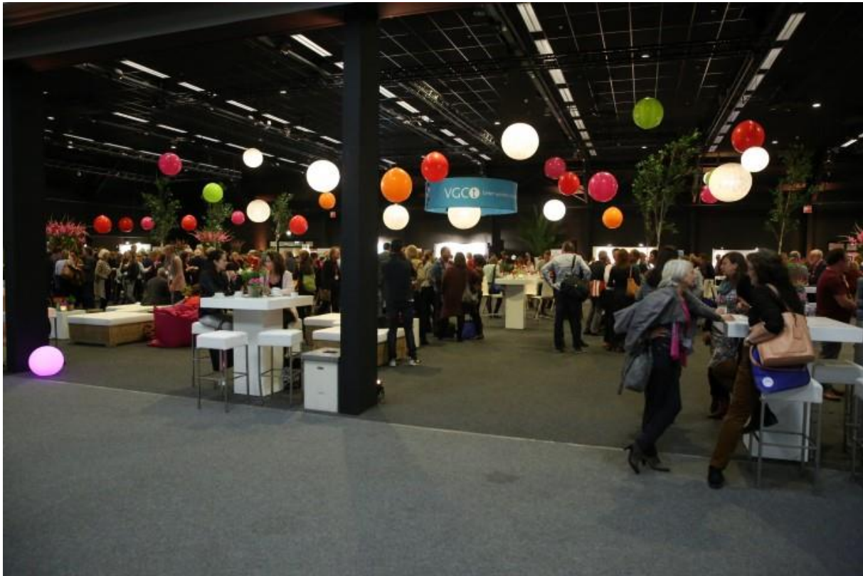
Inkijk Kempenzaal, vanuit de doorloop naar de Beneluxzaal.