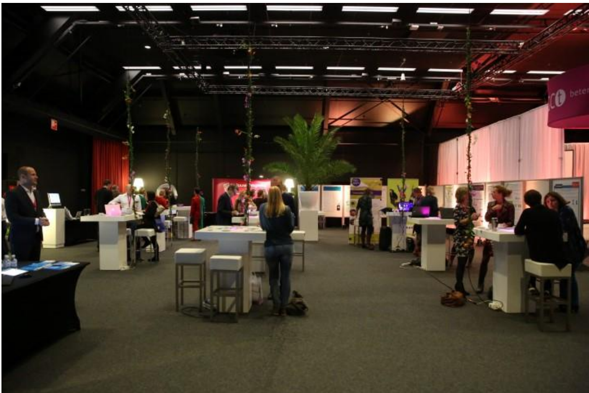
Helft Diezezaal, vanuit Kempenzaal (tijdens opbouw).