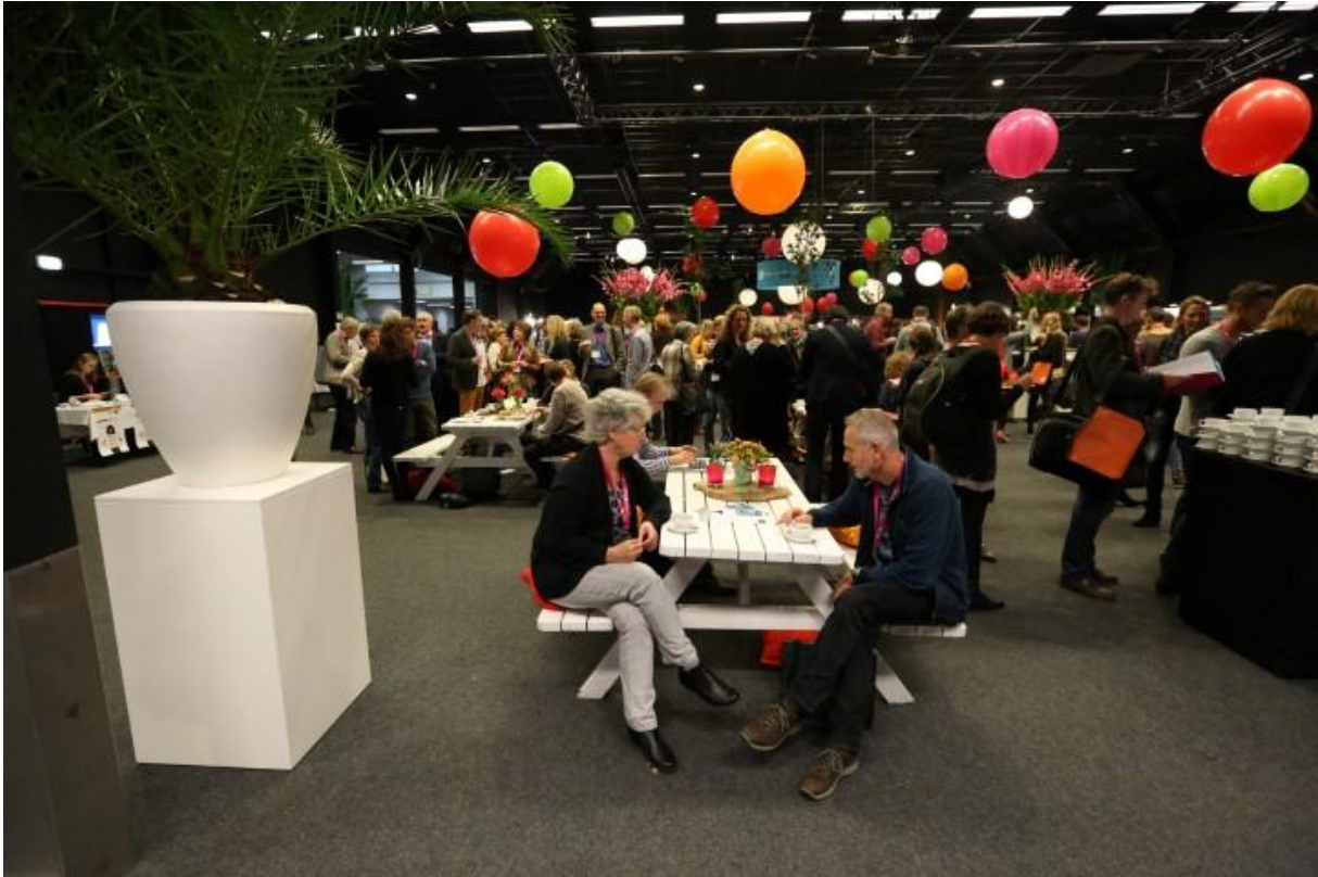
Kempenzaal, vanuit Genderzaal.