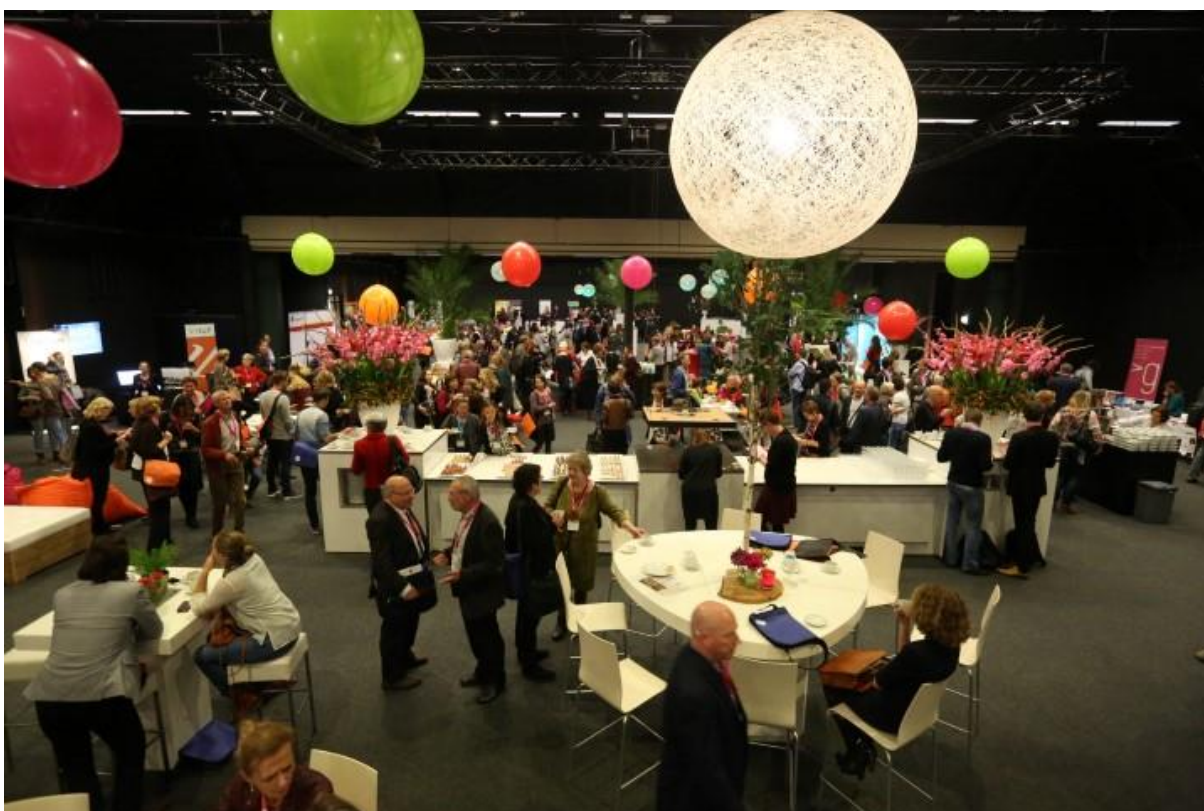
Kempenzaal richting Genderzaal, vanuit het midden van de zaal.