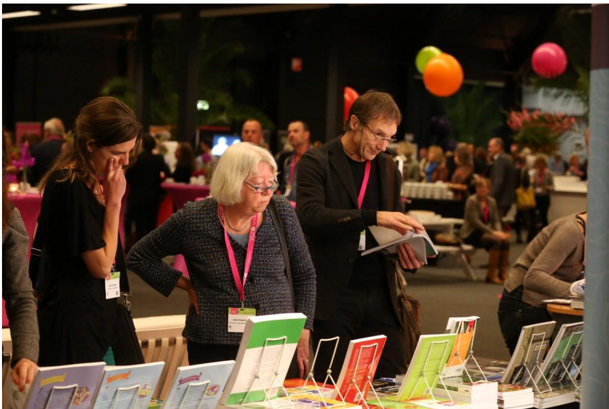
Stands in Diezezaal.